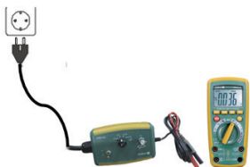
Toma de corriente del sistema IT